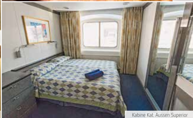
Kabine Kat. Aussen Superior