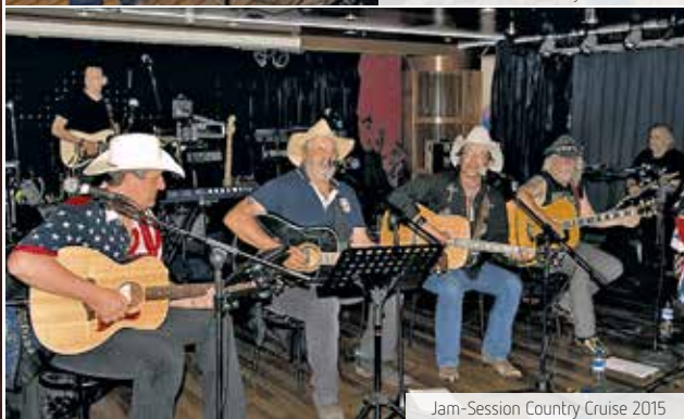
Jam-Session Country Cruise 2015