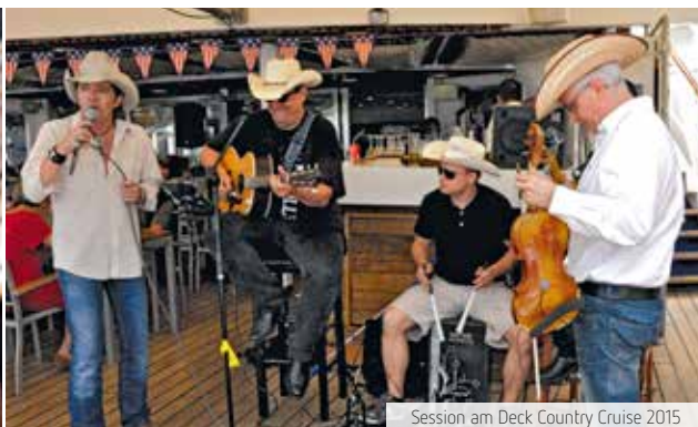
Session am Deck Country Cruise 2015