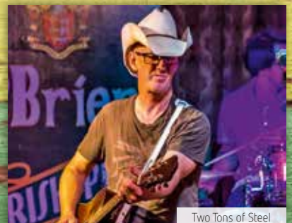
Two Tons of Steel